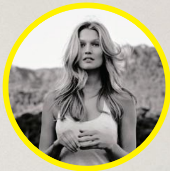
TONI GARRN, HET GEZICHT VAN DE KÉRASTASE-LIJN