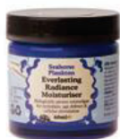
Beauty Kitchen, Seahorse Plankton Moisturizer, 24,99 euro