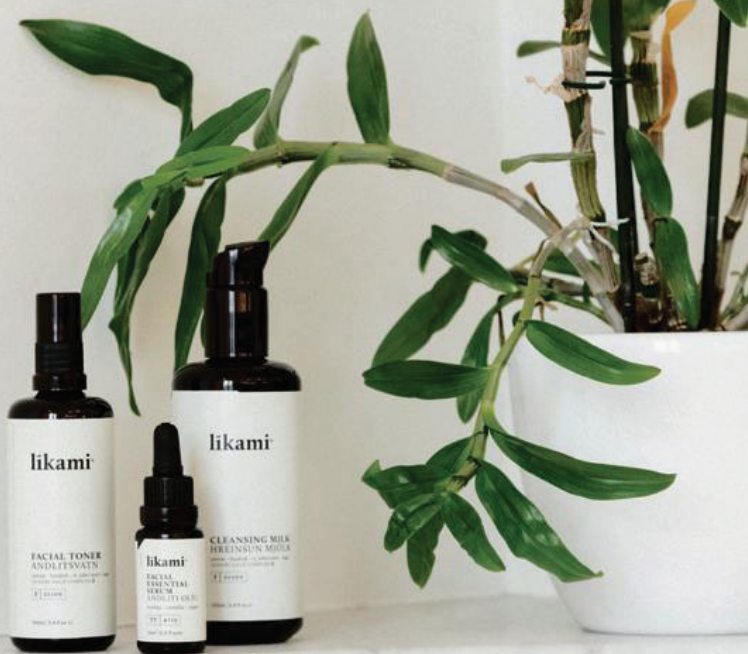
Het nieuwe Belgische cosmeticamerk Likami staat voor eco-luxueuze huidverzorgingsproducten.