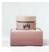
Self, Dagcrème, 57,66 euro