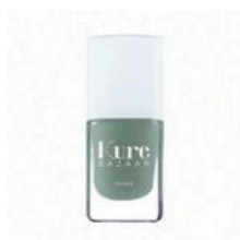
KureBazaar, Nagellak, 16,95 euro